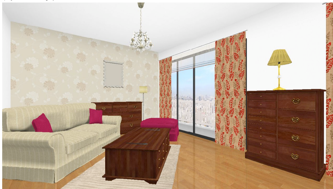
図 1:3D ウォークスルー