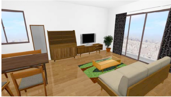
図 1:3D ウォークスルー